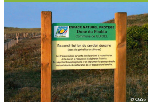
Dunes du Pouldu à Guidel (56)