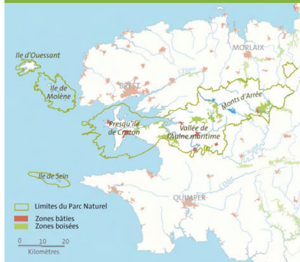
Le parc naturel régional d'Armorique

En 2005, le Parc a mis en ligne un portail cartographique numérique couvrant l'ensemble de son territoire. Le site Internet www.armoris.fr a pour but de mettre à la disposition des collectivités membres, des partenaires et du grand public, un outil d'aide à la décision innovant.